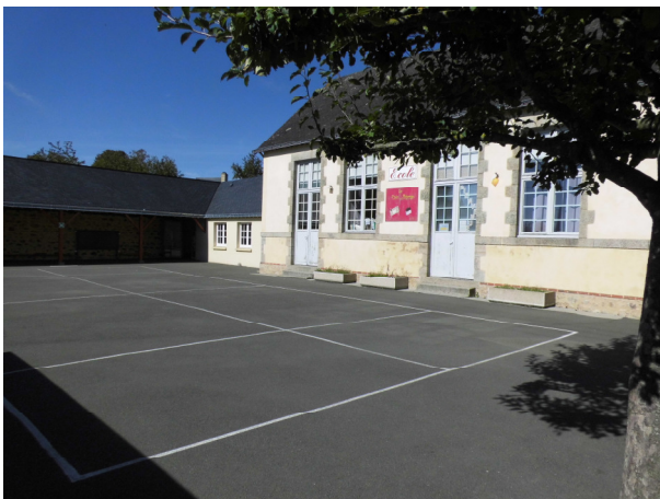
L'école Les P'tites Mézanges - Mézangers