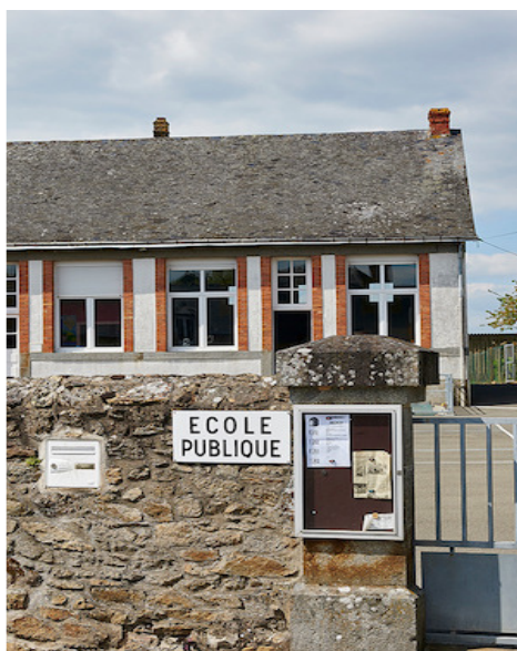
L'école du Rocharde - Ste Gemmes-le-Robert